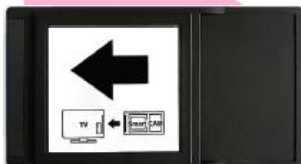
CA modul Nagra

Děkujeme, že využíváte službu MAGENTA TV, která vám umožní sledovat televizní vysílání prostřednictvím satelitní distribuce televizního obsahu. Koncové zařízení, tzv. CA modul („CAM“), popisovaný v tomto manuálu, je zařízení, které má za úkol dekódovat příjem satelitního vysílání tak, aby jej bylo možné zobrazit na vašem televizoru.